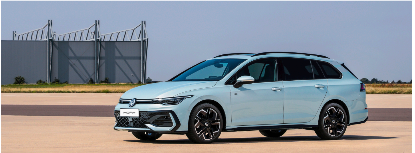
z.B. Golf Variant R-Line 2,0 | TDI SCR 110 kW (150 PS) 7-Gang-Doppelkupplungsgetriebe DSG