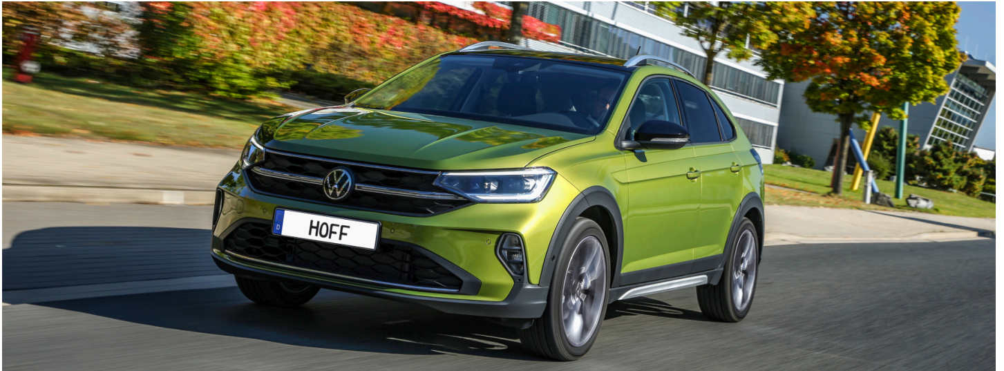
z.B. Taigo Life 1,0 | TSI OPF 70 kW (95 PS) 5-Gang